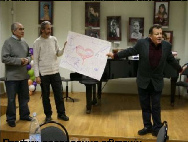
График проведения занятий: 20.00 - 21.00 - в СР, 10.00 - 12.00 - в ЧТ, 12.00 - 14.00 - в ПТ